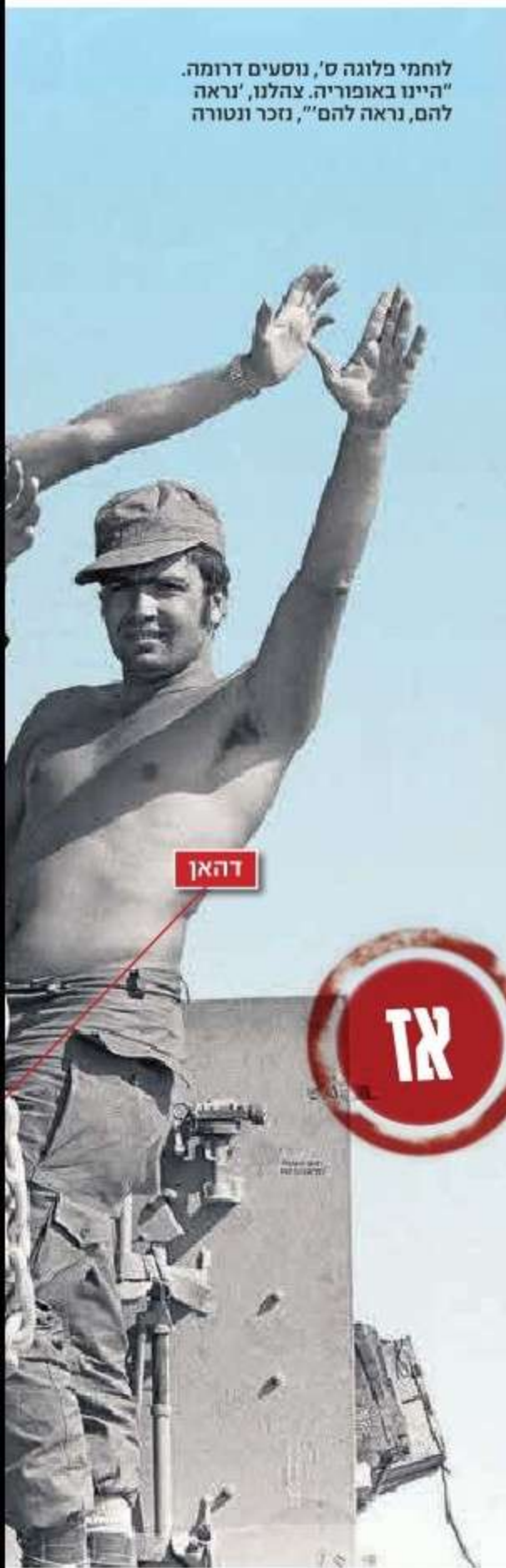
לוחמי פלוגה ס', נוסעים דרומה. היינו באופוריה. צהלנו, נראה להם, נראה להם, נזכר ונטורה