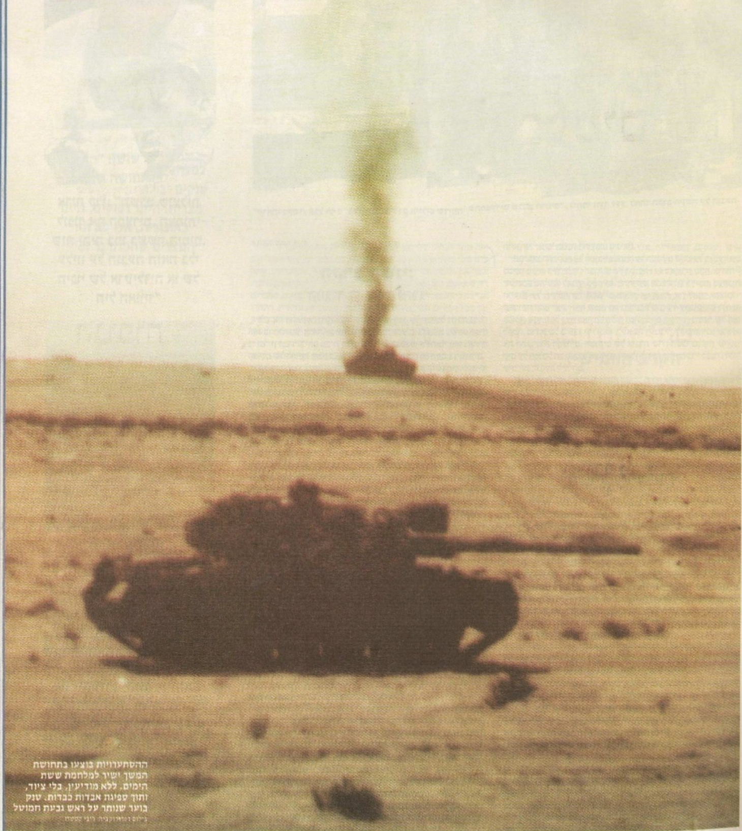
ההסתערות בוצעה בתחושח המשך ישיר למלחמת ששת הימים. ללא מודיעין, בלי ציוד, ותוך סמיגה אבודה כבדות. שנק בוער שנותר על ראש גבעת המוטל גילום ומצוקות לוחי הסדר