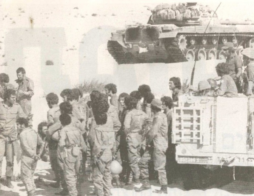
"קראתי בקשר, אבל אף מ"פ לא ענה. היו רק חיילים שדיווחו שהמפקדים שלהם הרוגים". לוחמי גרוד 599, לאחר הקרב הקשה על הגבעה