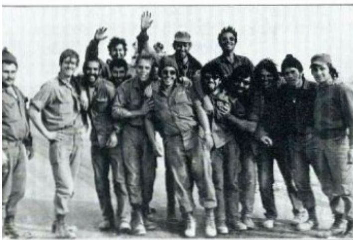
אנשי החימוש באפריקה