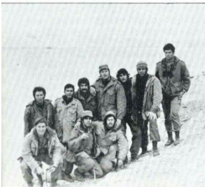
פלוגה אי על גדות התעלה