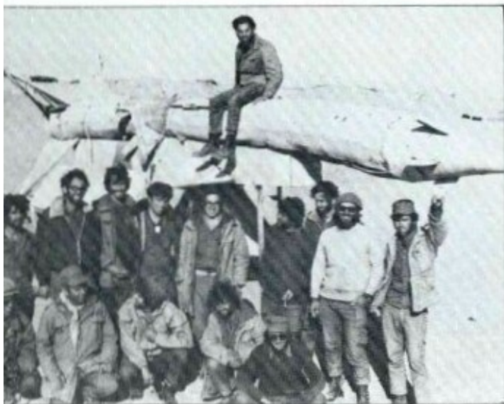
החובשים על טייל שקוצצו כנפיו