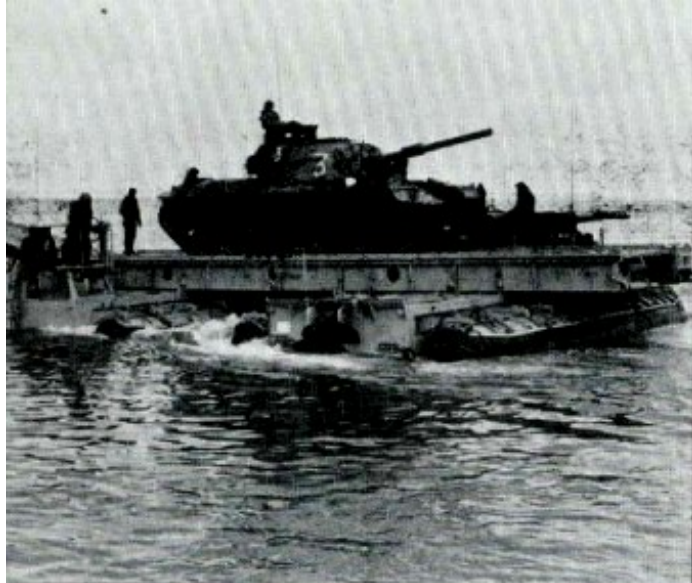
חוצים על התמסחים