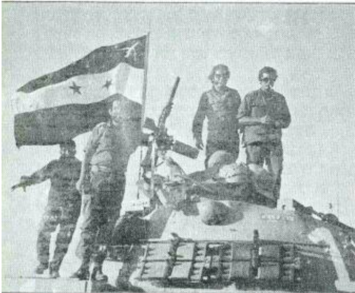
הטנק של אדרת - דגל השלל המצרי

כאן בניצנה עלינו שוב לכלים ונפרסנו בתרגיל ענק שהביאנו חזרה לשדה תימן. בסוף פברואר 1974 שבנו להיות אזרחים - חמישה וחצי חודשים מן היום בו נקרעו בבת אחת מחיי יום יום, המשפחה והעבודה.