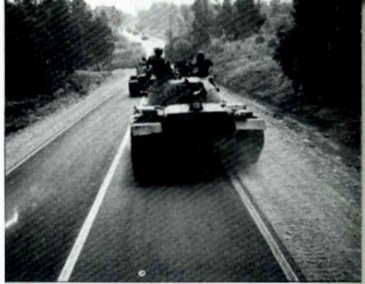
על הזחלים - בדרך מג'וליס